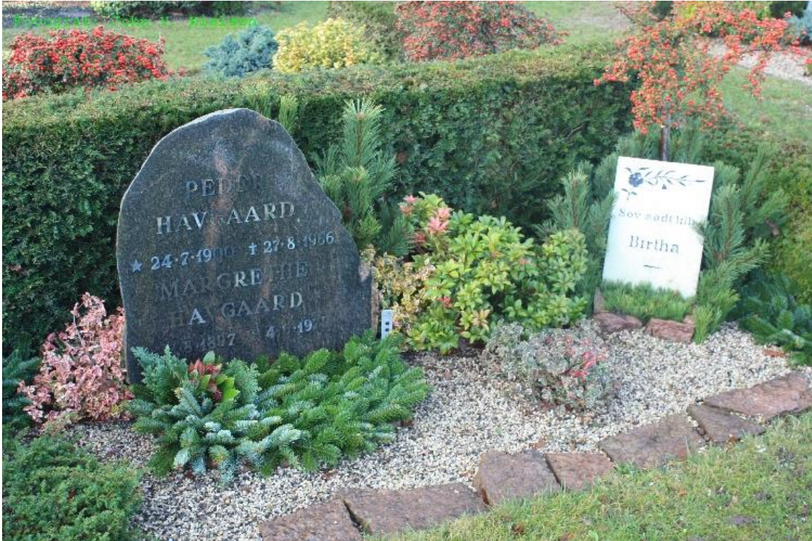
Gravstedet på Vorde kirkegård.